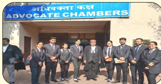
अधिवक्ता संघ विलासपुर