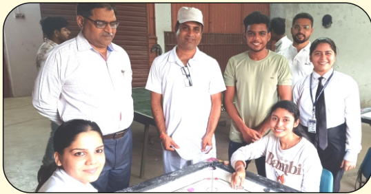
केरम खेलते हुये