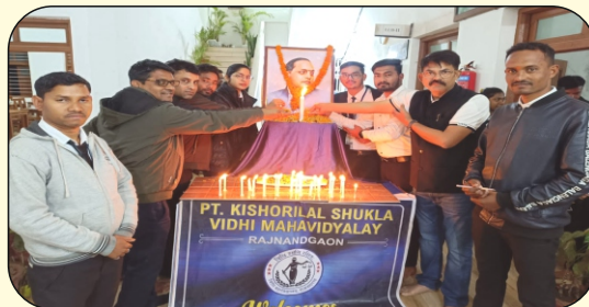
अंबेडकर जी को श्रद्धासुमन अर्पित