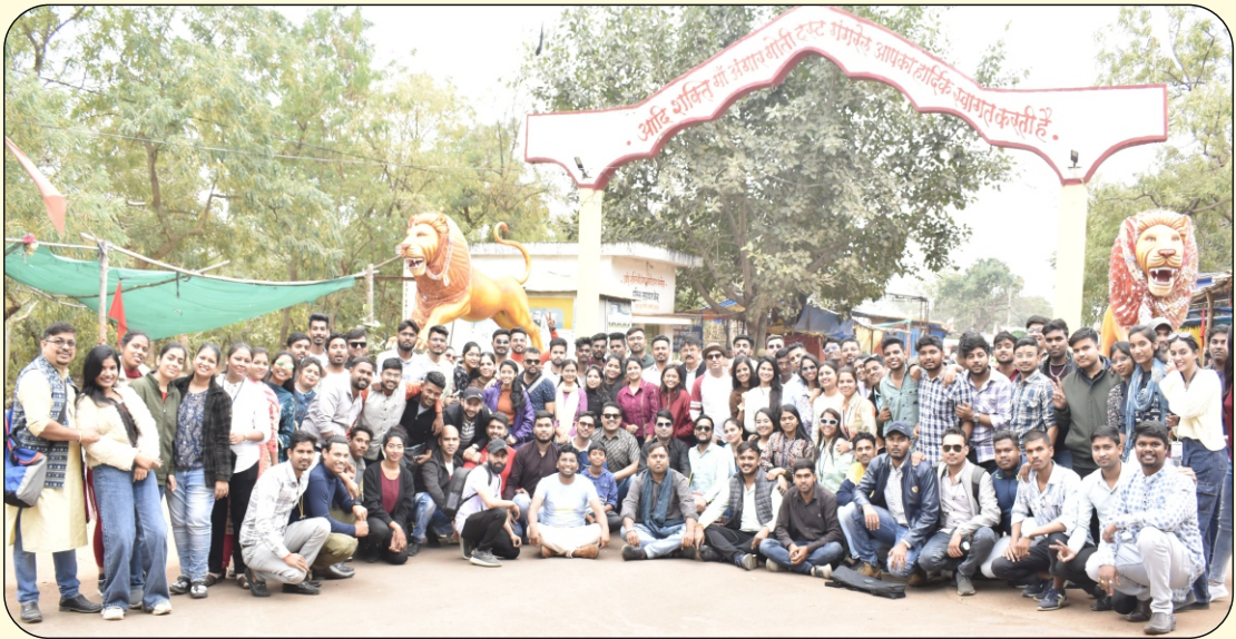
अंगार मोती मे सामूहिक फोटो