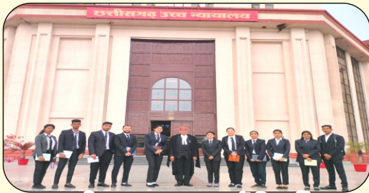
छत्तीसगढ़ उच्च न्यायालय में विद्यार्थी