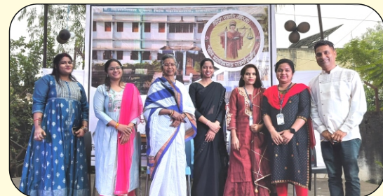
संविधान दिवस मानते हुये