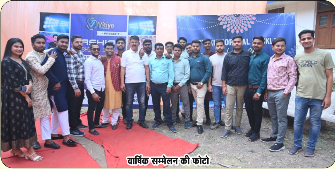
वार्षिक सम्मेलन की फोटो