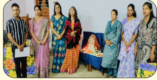
प्रो. शेवता मैडम के द्वारा सेमिनार