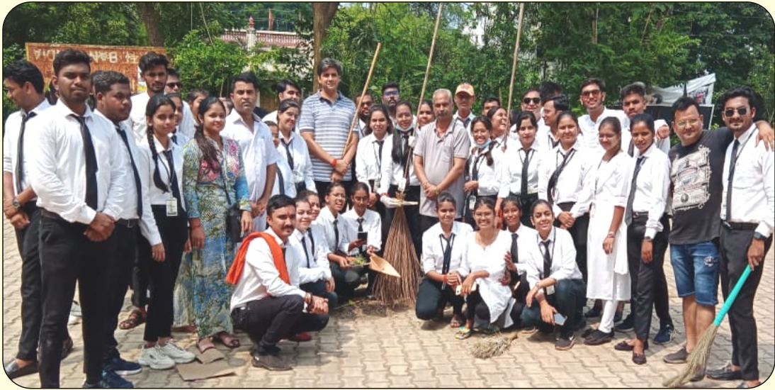
स्वच्छता अभियान की ग्रुप फोटो