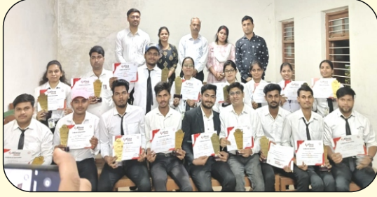
रक्तवीरो को प्रमणपत्र