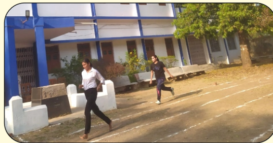
100 मीटर की दौड़