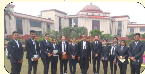
छत्तीसगढ़ उच्च न्यायालय भवन